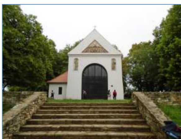
Kaple sv. Rocha