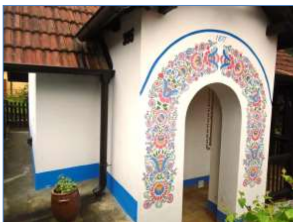
Vinný sklep v Mařaticích