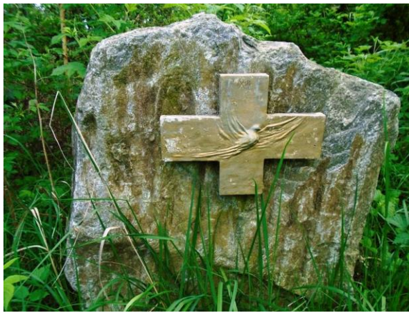
5. zastavení: Šimon pomáhá Pánu Ježíši nést kříž 13. zastavení: Tělo Pána Ježíše sňato z kříže

Znovu jsme se vrátili na silnici a vlevo od ní byla další zajímavost – lavičky a socha sv. Zdislavy s jejími čtyřmi dětmi a letopočtem 1252, rokem jejího úmrtí. Po krátkém odpočinku jsme otočili směr a zamířili k obci Lubné. Vpravo od silnice je studánka sv. Jiljí i s jeho sochou, v Lubném na vršku zase stojí hezky upravená kaple. Silnice nás pak zavedla k viaduktu v Kutinách a podél potoka Libochovky ke známému Ranči u Bizona. Měli obsazeno, občerstvili jsme se až o kousek dál U Trempů. Cestou do Řikonína jsou ze silnice pěkné výhledy, další kaplička a u ní lavička, krmítko pro ptáky a houpačka. A to už jsme byli v Řikoníně, došli na nádraží a odjeli do Brna.