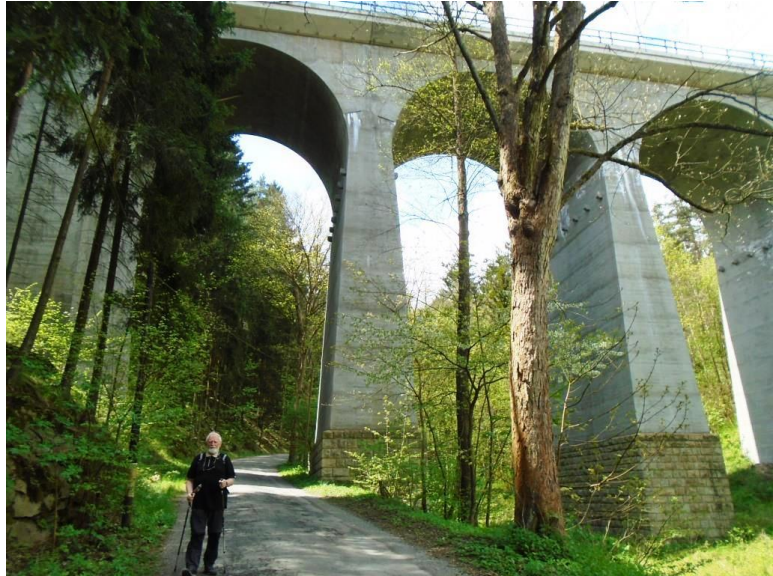
Viadukt u Kutin