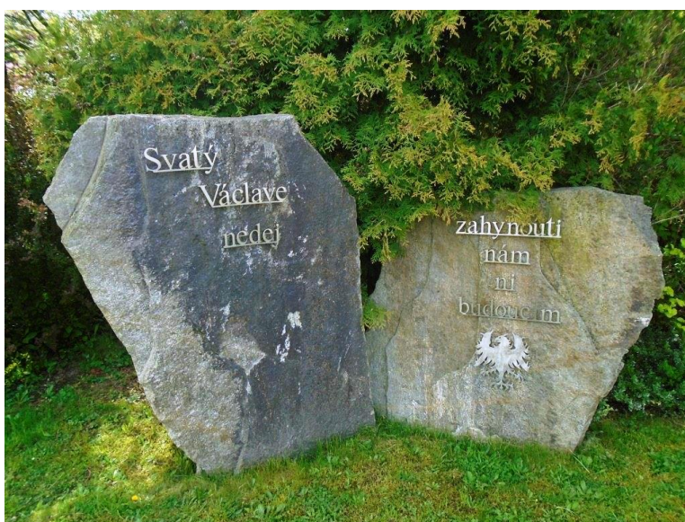
Níhov, kaple a pomník sv. Václava