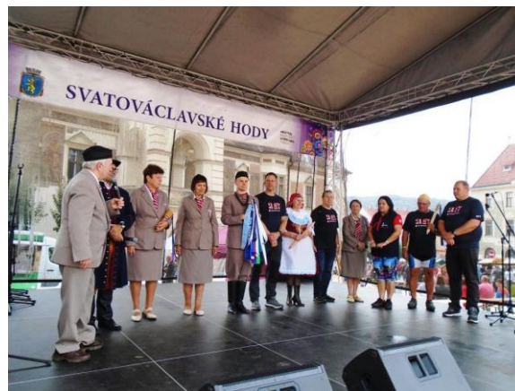
Privítání sletové štafety jihomoravských sokolských žup v Tišnově