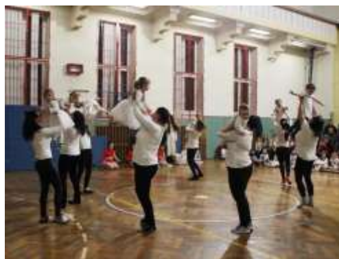
RD: Andělé strážní