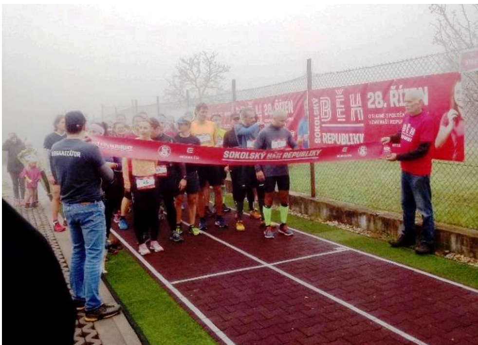
Sokolský běh republiky, Babice nad Svitavou 28. 10. 2022