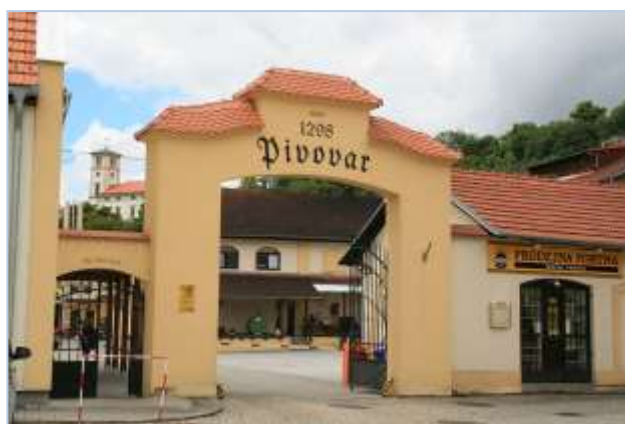
Zámek a pivovar Černá Hora

Ze Zámeckého vrchu jsme sestoupili do Černé Hory k pivovaru , občerstvili se v pivovarské restauraci a autobusem se vrátili do Brna.