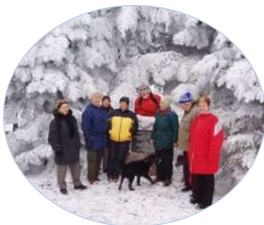
Silvestrovská vycházka v roce 2007