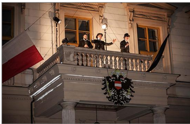
29. října 2018

29. října 2018 jsme v Brně u Besedního domu na Komenského náměstí oslavili výročí vzniku samostatného Československa. Proč až o den později? Tehdy se zpráva dostala do Brna se zpožděním – vlivem zmatků a přerušeno spojení. Většina obyvatel se tak o vyhlášení republiky dozvěděla z balkonu Besedního domu. Přesně po 100 letech a přesně na stejném místě jsme mohli vidět, jak situace tehdy vypadala. A stejně jako tenkrát se pod balkonem shromáždily stovky lidí. (HR)