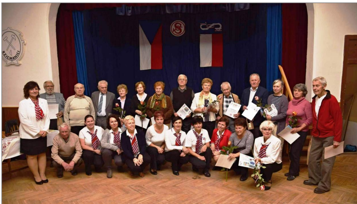
Ocenění členové a výbor Sokola Říčmanice