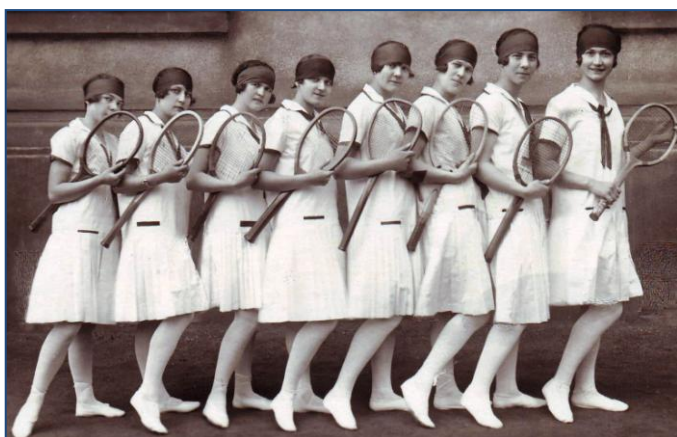
Cvičení žen s raketami (1927)