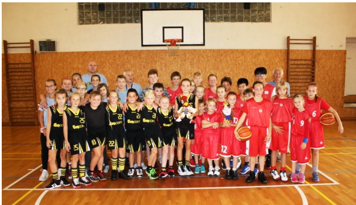
Úspěšní podolští basketbalisté v Kraslicích