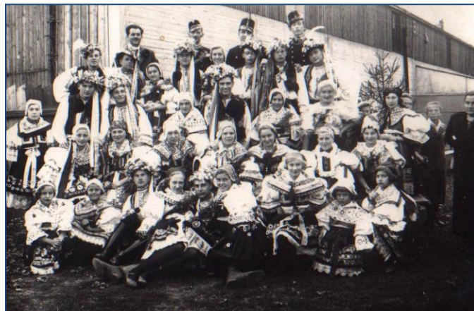
Hody Sokola Brno IV (1936)