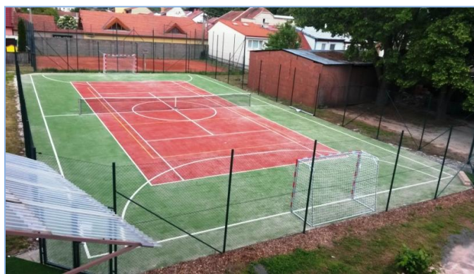
Původní a nové hřiště Sokola Brno-Líšeň