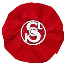
Kokarda k Památnému dni sokolstva

Vždy, když to vlast potřebovala, byli sokolové připraveni hájit ji se zbraní v ruce – ať již v legiích bojujících v 1. světové válce za samostatný stát, tak v letech 1918-1920 při obraně nově vzniklé republiky, nebo v letech 1938-1945 v boji proti nacistické okupaci.