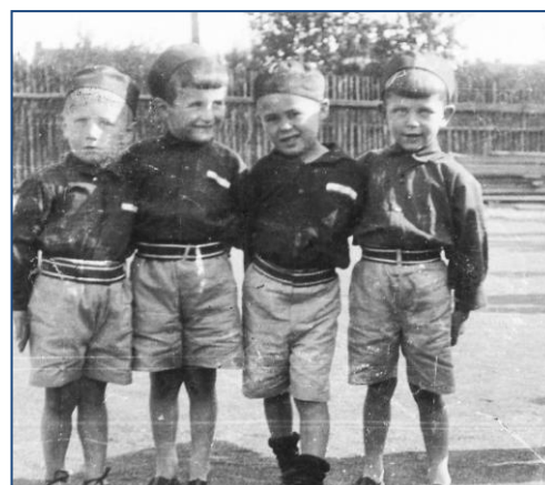
Malí sokoláci (1932)