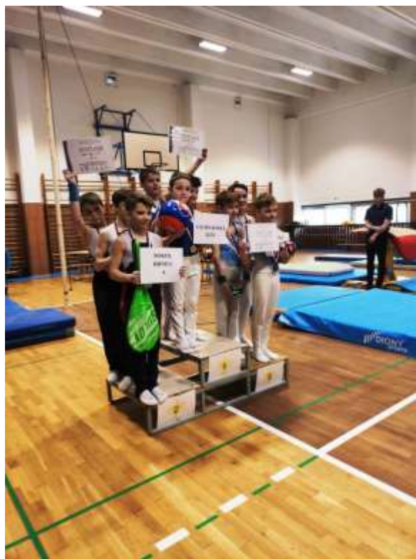
Vítězná družstva: 1. Gymnastika Zlín, 2. Sokol Brno I, 3. Sokol Šternberk